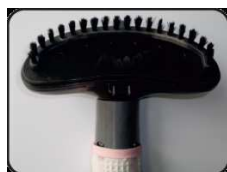
Насадка-щетка для отпаривания одежды, полотенца, постельного белья