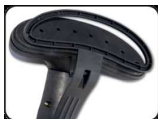
Зажим для отпаривания стрелок на брюках