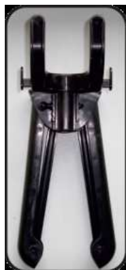
Складная вешалка с 2 зажимами