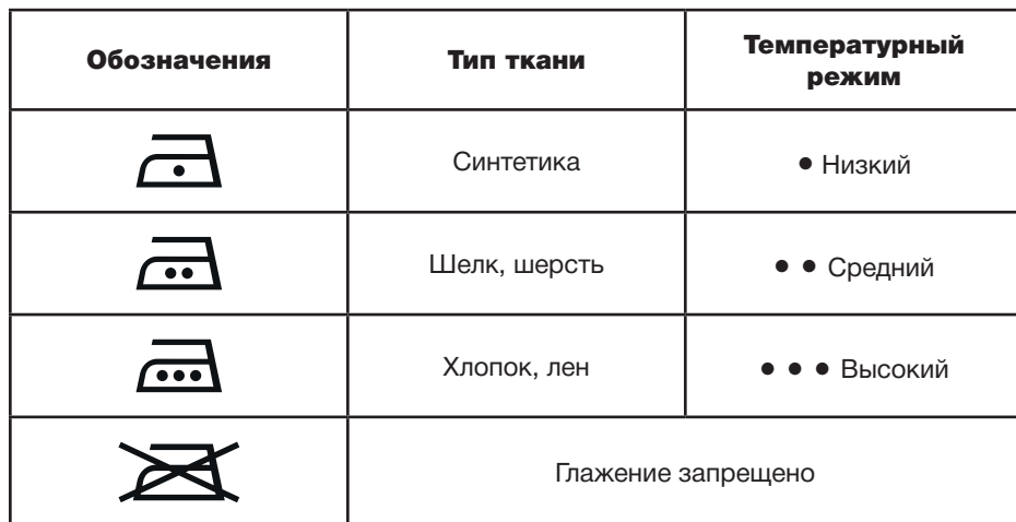
Таблица может быть использована только для гладких тканей. Если на ткани присутствует рельеф, оборки, нашивки и прочие декоративные элементы, рекомендовано производить глажение при низких температурах.

Перед началом работы изучите информацию о допустимых режимах глажения на ярлыке изделия. В случае если ярлык с рекомендациями отсутствует, но известен материал изделия, обратитесь к таблице.