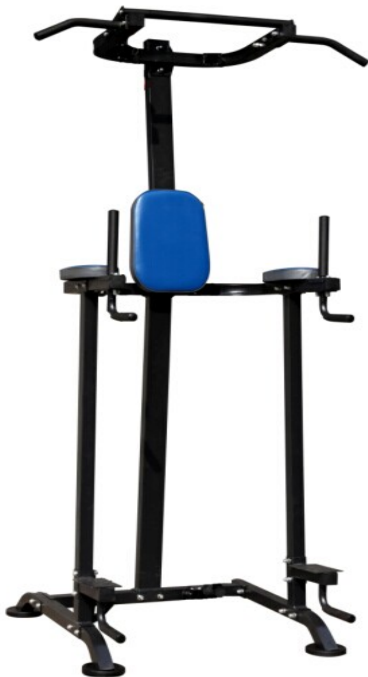
Турник-брусья DFC VT-7003