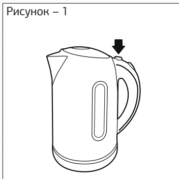
Рисунок – 1