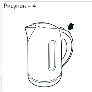
Рисунок – 4

— Включите чайник, нажав кнопку (переведя выключатель в положение 1).