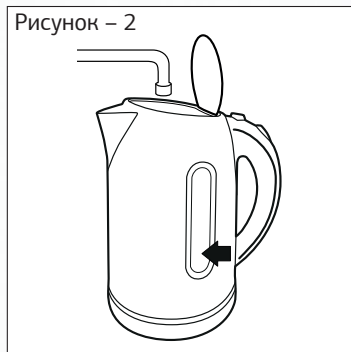
Рисунок – 2

— Наполните чайник холодной водой, следите за метками.