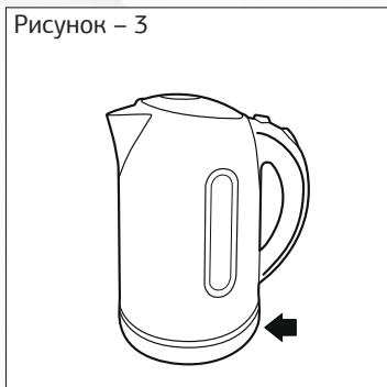
Рисунок – 3

— Наполните чайник холодной водой, следите за метками.